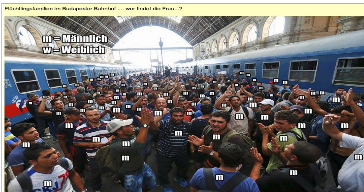
Wer findet die Frau?

Über 90% der Einwanderer sind Männer. Wieso bitte sind diese, wenn doch in ihren Ländern Krieg herrscht, nicht an der Front, um ihr Land zu verteidigen? Warum lassen sie ihre Frauen und Kinder im Stich? Warum bauen sie ihr Land nicht wieder auf, so wie es die Deutschen nach 1945 getan haben, was angesichts von Horden von "Facharbeitern" kein Problem sein dürfte. Wenn wehrfähige Männer aus einem Kriegsgebiet in andere Länder reisen, nennt man sie normalerweise Deserteure. Macht nichts, denn ein erstes Kontingent von Bundeswehrsoldaten soll laut Beschluß des Bundestages in Übergangung eines fehlen UN-Mandats und gegen den Willen der syrischen Regierung in Syrien kämpfen, während die echten und vermeintlichen Migrantensyrer hier eine ruhige Kugel schieben. Jeder betroffene Soldat sollte sich daher überlegen, ob er gegen Völkerrecht und Gewissen sein Leben oder seine Gesundheit riskiert.